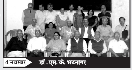
4 नवम्बर डॉ. एम. के. भटनागर